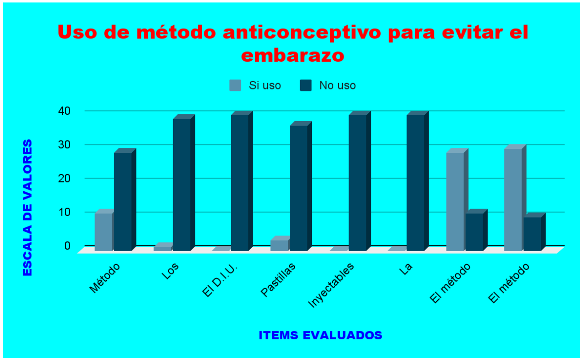
Figura 03: Uso de método anticonceptivo para evitar el embarazo.