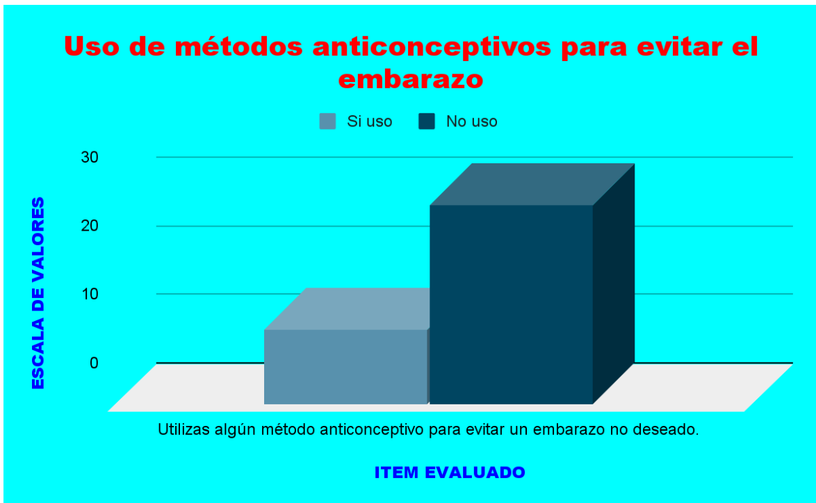
Figura 02: Uso de métodos anticonceptivos para evitar el embarazo.