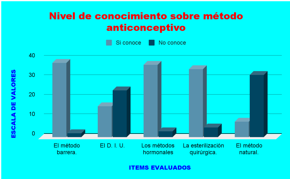
Figura 01: Nivel de conocimiento sobre método anticonceptivo.